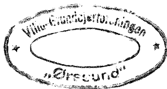
Villabyen ved Øresundsvej, Amager.