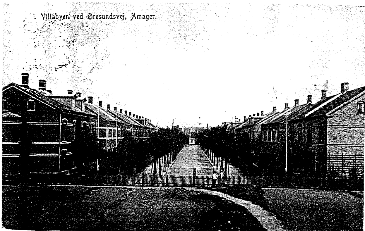
Kongedybs Allé set fra Sixtusvej mod Øresundsvej i „Eberts ny Villaby“. De ensartede dobbelthuse i gule og røde sten svarede til forestillingen om en arbejderby, men indtrykket mildnes af allébeplantningen og de relativt store havearealer mellem husrækkerne. Postkort fra ca. 1905.